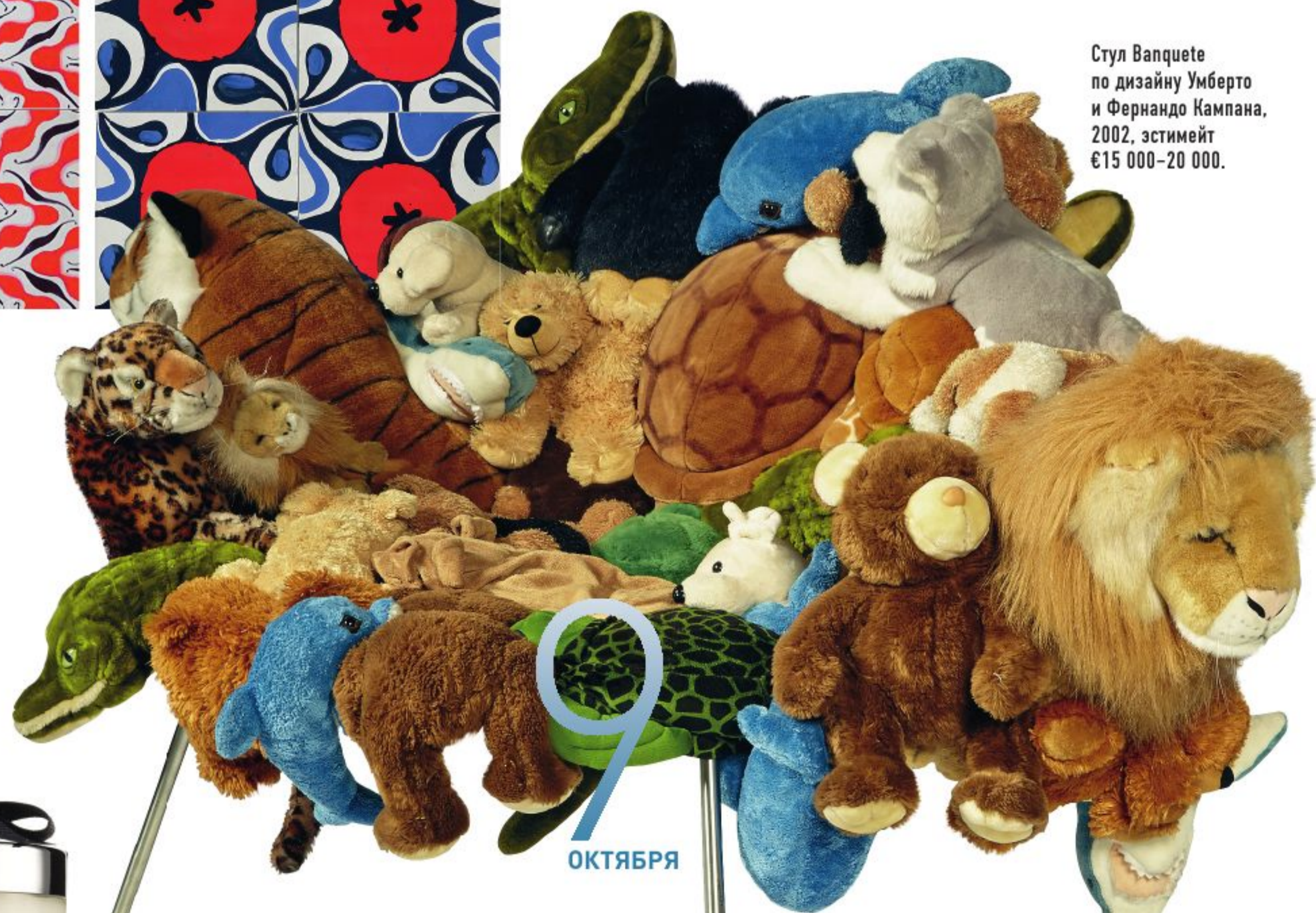
Стул Vanquete по дизайну Умберто и Фернандо Кампана, 2002, эстимейт €15 000–20 000.

В 1932 году Коко Шанель представила свою первую ювелирную коллекцию на закрытой вечеринке в Париже. В память об этом событии в прошлом году ювелиры Chanel создали серию украшений под названием 1932, которую всего на два дня привезут в Москву, чтобы показать на выставке в Историческом музее. Как и восемьдесят один год назад, попадут туда только избранные.